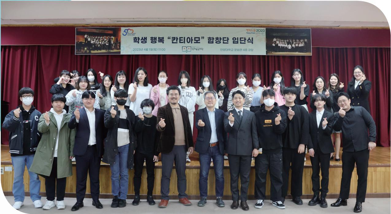
학생행복 칸티아모 합창단 입단식 단체사진