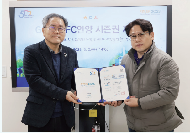
주식회사 GS파워, 시즌권 기부증서 전달