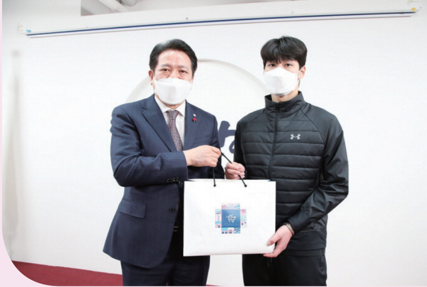
2013~2020년 안양시 인재육성재단 장학생 황대현 쇼트트랙 국가대표 선수(베이징 올림픽 금메달리스트)