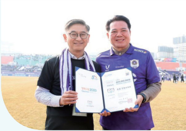
농협 안양시지부 FC안양, 시즌권 기부증서 전달