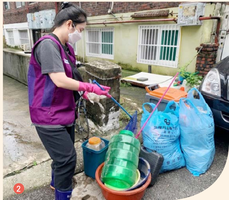
① 안양 착한기부 캠페인 모금 ② 집중호우 피해복구 지원 봉사