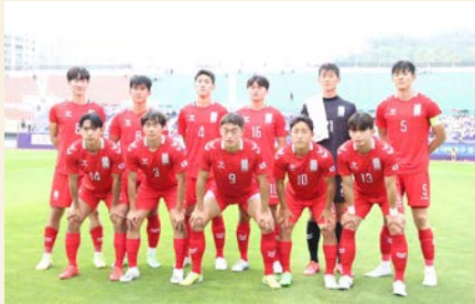
덴스컵 한일대학축구 정기전